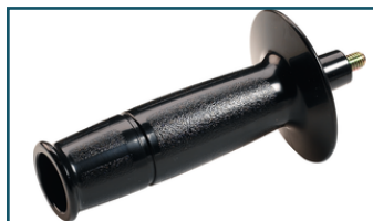
Handgreep M8 (1 stuks)