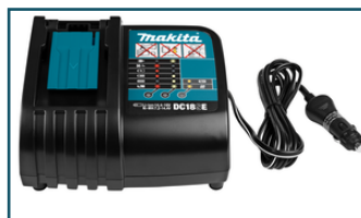
Auto oplader LXT DC18SE (1 stuks)