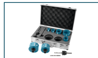
Gatzaagset 10-dlg bl. E-inst. (6 stuks)