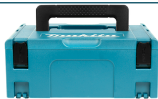
Mbox nr.2 (1 stuks)