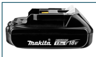
Accu BL1815N LXT 18V 1,5Ah (1 stuks)