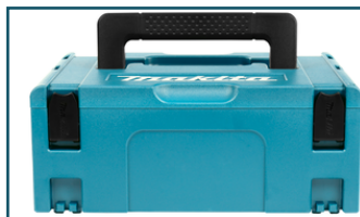
Mbox nr.2 (1 stuks)