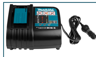
Auto oplader LXT DC18SE (1 stuks)