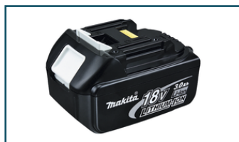
Accu BL1830 LXT 18V 3,0Ah (1 stuks)