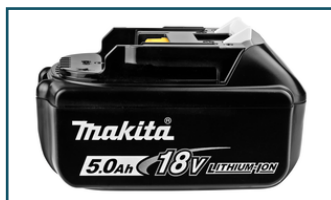
Accu BL1850B LXT 18V 5,0Ah (1 stuks)