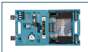
Boor-/schroefbitset 104-delig (6 stuks)