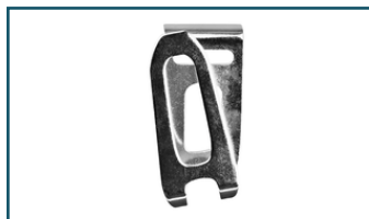
Draaghaak lang (1 stuks)