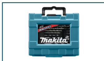
Boor-/schroefbitset 34-delig (6 stuks)