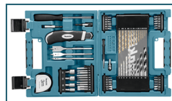
Boor-/schroefbitset 71-delig (6 stuks)