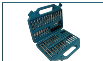
Boor-/schroefbitset 42-delig (6 stuks)