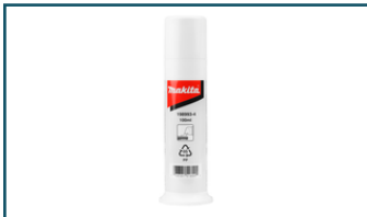
Boor- en beitelvet 100ml dispenser (1 stuks) - 198993-4 - 0088381518994