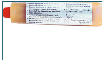
Boor- en beitelvet 100ml tube (1 stuks) - 181573-3 - 0088381116619