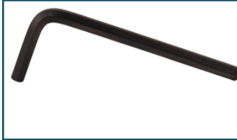
Inbussleutel 6,0mm (1 stuks) - 783204-6 - 0088381102681