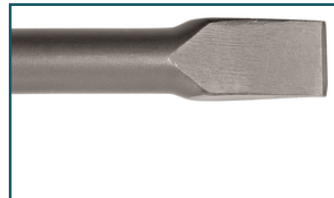
Koudbeitel 30x400mm (1 stuks) - D-15300 - 0088381186384