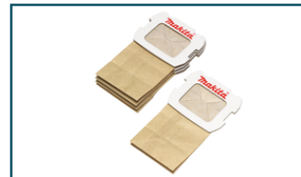
Stofzak "papier" set (1 stuks)