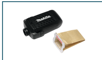
Stofbox met papieren stofzak (1 stuks)