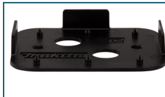
Perforatieplaat (1 stuks)