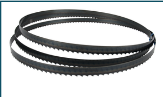
Zaagband 730x13mm 14T (1 stuks) - E-04101 - 0088381563536