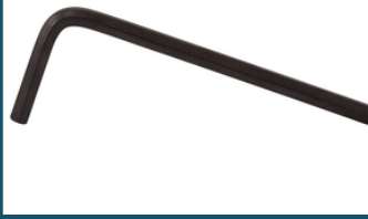
Inbussleutel 4,0 mm (1 stuks) - 783202-0 - 0088381102667