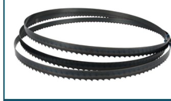
Zaagband 730x13mm 18T (1 stuks) - E-04117 - 0088381563543