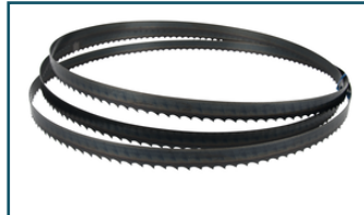
Zaagband 730x13mm 18T (1 stuks) - E-04117 - 0088381563543