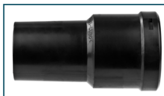
Slangadapter 45/38mm [Machine] (1 stuks) - 417307-1 - 8720023006064