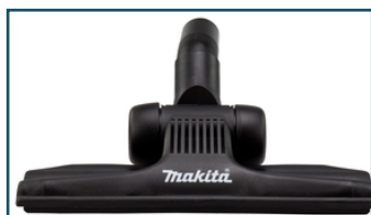
Vloerzuigmond (1 stuks) - 199455-5 - 0088381539692