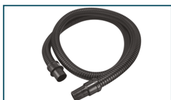
Zuigslang 38x2500mm (1 stuks) - 195434-1 - 0088381370271

Dit is slechts een kleine greep uit het ruime assortiment. Kijk voor alle accessoires/verbruiksartikelen in de Catalogus of op www.makita.nl .