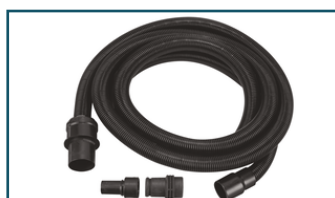
Zuigslang 28x3500mm (1 stuks) - 195433-3 - 0088381370264