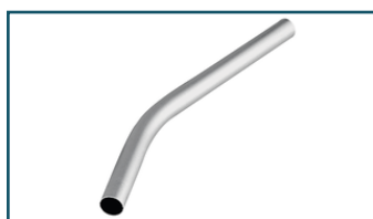
Zuigbuis bocht alu (1 stuks) - 192562-3 - 0088381141116