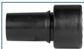
Slangadapter 25/22mm [Machine] (1 stuks) - 417765-1 - 3240890348234