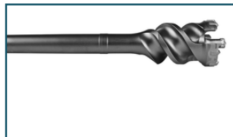
Freeskroon 55x550mm SDS-MAX (1 stuks) - B-57657 - 0088381519892