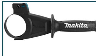
Zijhandgreep boren/breken (1 stuks) - 123138-5 - 3240890424273