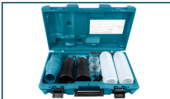
Stofafzuigadapter boren/breken (set) (1 stuks) - 199142-6 - 0088381524339