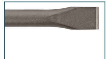
Koudbeitel 25x280 mm SDS-MAX (1 stuks) - P-16265 - 0088381932295

Dit is slechts een kleine greep uit het ruime assortiment. Kijk voor alle accessoires/verbruiksartikelen in de Catalogus of op www.makita.nl .