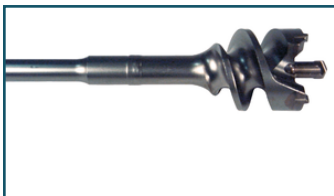
Freeskroon 45x550mm SDS-MAX (1 stuks) - P-21901 - 0088381948999