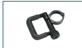
Zijhandgreep D voor breken (1 stuks) - 196792-8 - 3240890452900