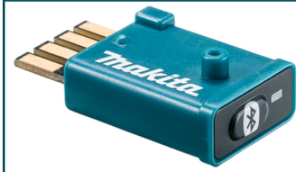
AWS zender WUT01 (1 stuks) - 198900-7 - 0088381497749