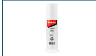
Boor- en beitelvet 100ml dispenser (1 stuks) - 198993-4 - 0088381518994