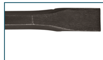
Koudbeitel 20x250 mm SDS-PLUS (1 stuks) - D-08729 - 0088381179539

Dit is slechts een kleine greep uit het ruime assortiment. Kijk voor alle accessoires/verbruiksartikelen in de Catalogus of op www.makita.nl .