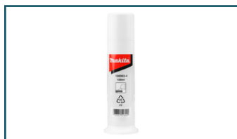
Boor- en beitelvet 100ml dispenser (1 stuks) - 198993-4 - 0088381518994