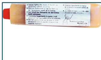
Boor- en beitelvet 100ml tube (1 stuks) - 181573-3 - 0088381116619