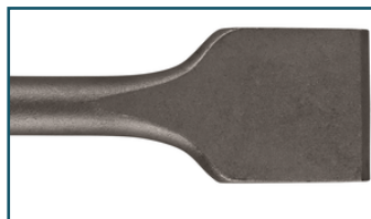
Platbeitel 38x200 mm SDS-PLUS (1 stuks) - A-30483 - 0088381147736