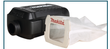
Stofbox met polyester stofzak (1 stuks) - 135327-0 - Goingsprijs € 12,00