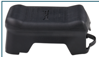
Beschermkap (1 stuks) - 422807-8 - Goingsprijs € 3,85 - 8720023171328