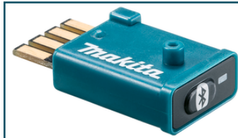
AWS zender WUT01 (1 stuks) - 198900-7 - Goingsprijs € 50,00 - 0088381497749