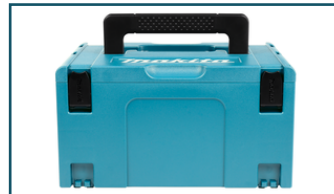
Mbox3 (1 stuks) - 821551-8 - Goingsprijs € 55,00 - 0088381432993