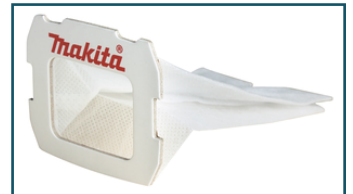
Polyester stofzak voor stofbox (1 stuks) - 168557-8 - Goingsprijs € 2,00

Dit is slechts een kleine greep uit het ruime assortiment. Kijk voor alle accessoires/verbruiksartikelen in de Catalogus of op www.makita.nl .