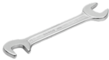
Liliput steeksleutels, inch maten 5/32", 80mm 1931Z-5/32