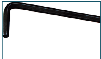
Inbussleutel 3,0 mm (1 stuks)