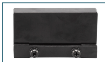
Schaafbeitel afstelmal (1 stuks) - 123062-2 - 0088381111270