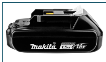
Accu BL1815N LXT 18V 1,5Ah (1 stuks) - 196235-0 - 0088381417556