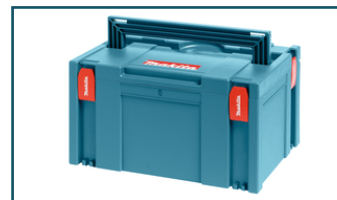
Mbox nr.3 (1 stuks) - P-72366 - 0088381702959