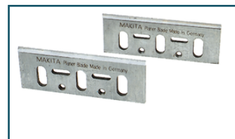
HM schaaftbeitels 82mm (1 stuks) - D-07967 - 0088381181624

Dit is slechts een kleine greep uit het ruime assortiment. Kijk voor alle accessoires/verbruiksartikelen in de Catalogus of op www.makita.nl .