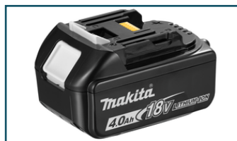
Accu BL1840 LXT 18V 4,0Ah (1 stuks) - 196399-0 - 0088381426749