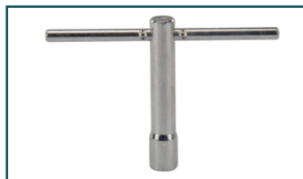
Dopsleutel 9mm (1 stuks) - 782209-3 - 0088381102568