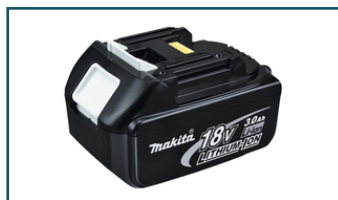
Accu BL1830 LXT 18V 3,0Ah (1 stuks) - 193533-3 - 0088381367004