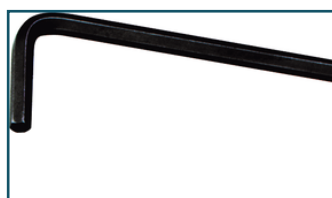
Inbussleutel 4,0 mm (1 stuks) - 783202-0 - 0088381102667