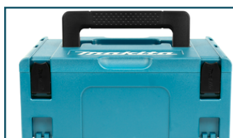
Mbox nr.2 (1 stuks) - 821550-0 - 0088381430128