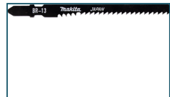
Decoupeerzgb hout 70mm BR13 (1 stuks) - A-85793 - 0088381149679