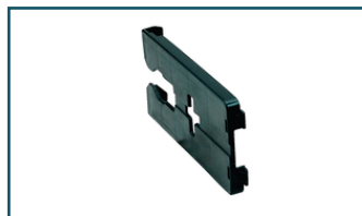
Beschermzool (1 stuks) - 417852-6 - 0088381177498