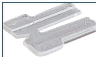
Anti-splinterplaat (1 stuks) - 192557-6 - 0088381132732