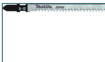
Decoupeerzgb hout 76mm B10 (1 stuks) - A-85628 - 0088381149716