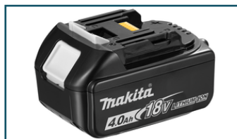
Accu BL1840 LXT 18V 4,0Ah (1 stuks) - 196399-0 - 0088381426749