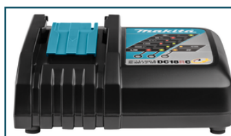
Oplader LXT DC18RC (1 stuks) - 195584-2 - 0088381373562