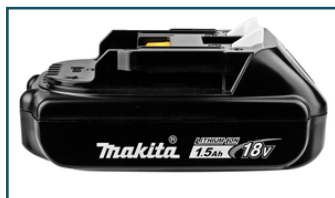
Accu BL1815N LXT 18V 1,5Ah (1 stuks) - 196235-0 - 0088381417556