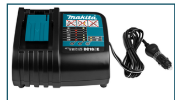
Auto oplader LXT DC18SE (1 stuks) - 194622-7 - 0088381349673

Dit is slechts een kleine greep uit het ruime assortiment. Kijk voor alle accessoires/verbruiksartikelen in de Catalogus of op www.makita.nl .