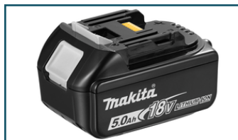
Accu BL1850 LXT 18V 5,0Ah (2 stuks) - 196671-0 - 0088381437967