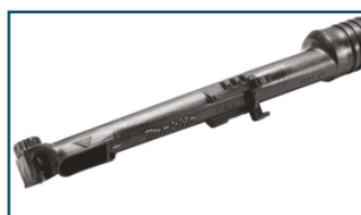
Stofafzuigadapter decoupeerzaag (1 stuks) - 196747-3 - 0088381438469