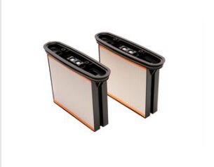
Artikel code 644006 POLYESTER FILTER (2 STUKS)