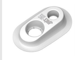
Artikel code 054117 DUSTER PRO STOFAFZUIGINGSADAPTER (10 ST)