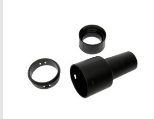
Artikel code 610122 EINDSTUK T.B.V. SLANG AC1600 / ASD40