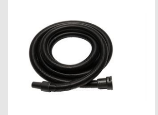
Artikel code 644004 SLANG STOFZUIGER ANTI-STATISCH - ALLE TYPES