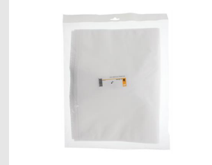
Artikel code 620922 STOFZUIGERZAKKEN FLEECE - ALLE TYPES (5 ST)