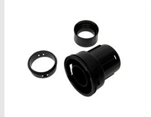
Artikel code 610123 AANSLUITSTUK (BAYONET)-SLANG STOFZUIGERS