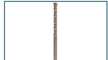
Steenboor 10x150mm (1 stuks) - D-05321 - 0088381176552

Dit is slechts een kleine greep uit het ruime assortiment. Kijk voor alle accessoires/verbruiksartikelen in de Catalogus of op www.makita.nl .