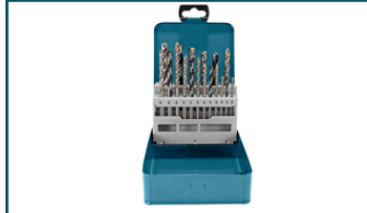
Borenset 18-dlg (1 stuks) - D-46202