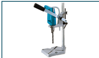
Boorstandaard Euronorm 43 (1 stuks) - A-36712 - 0088381183154