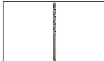
Steenboor 10x150mm (1 stuks) - E-06529 - 0088381569477