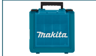
Koffer kunststof (1 stuks) - 824811-7 - 0088381351140