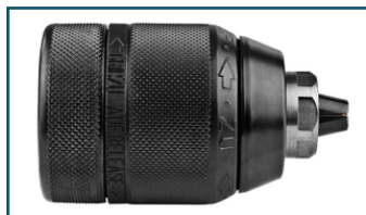
Boorkop snelspan 1,5-13 mm (1 stuks) - 192664-5 - 0088381141758