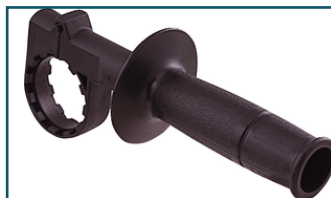
Handgreep compleet (1 stuks) - 135302-6 - 3240890306265