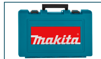
Koffer (1 stuks) - 824695-3 - 3240890275165