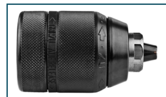
Boorkop snelspan 1,5-13 mm (1 stuks) - 192664-5 - 0088381141758

Dit is slechts een kleine greep uit het ruime assortiment. Kijk voor alle accessoires/verbruiksartikelen in de Catalogus of op www.makita.nl .