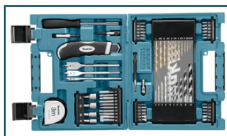
Boor/bit set 71-delig (6 stuks) - D-33691 - 0088381360586