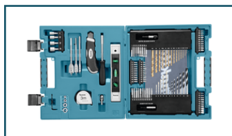
Boor/bit set 104-delig (6 stuks) - D-31778 - 0088381358590