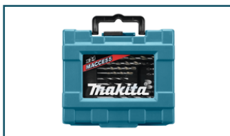
Boor/bit set 34-delig (6 stuks) - D-36980 - 0088381374248