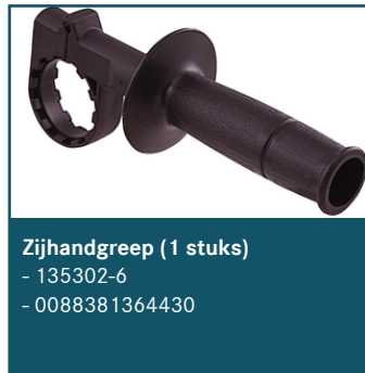
Zijhandgreep (1 stuks) - 135302-6 - 0088381364430