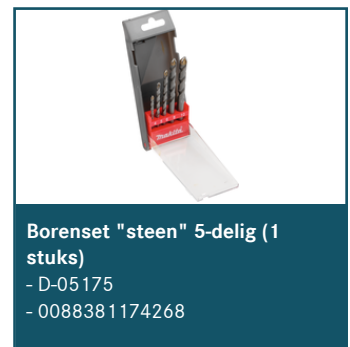
Borensset "steen" 5-delig (1 stuks) - D-05175 - 0088381174268

Dit is slechts een kleine greep uit het ruime assortiment. Kijk voor alle accessoires/verbruiksartikelen in de Catalogus of op www.makita.nl .