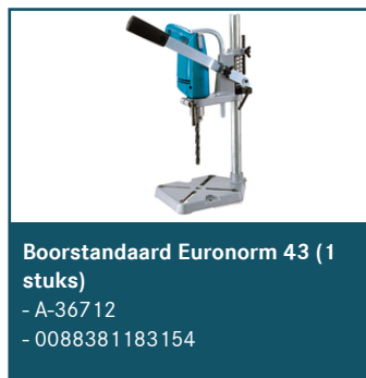
Boorstandaard Euronorm 43 (1 stuks) - A-36712 - 0088381183154