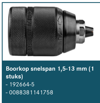
Boorkop snelspan 1,5-13 mm (1 stuks) - 192664-5 - 0088381141758