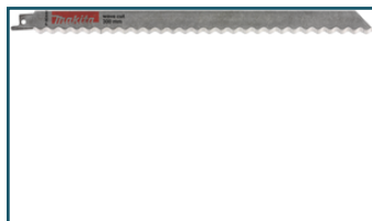
Reciprosnijblad 280 isolatie (1 stuks) - P-80444 - 0088381430999