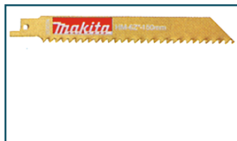
Reciprozaagb 130 HM S641HM (1 stuks) - P-05044 - 0088381914192