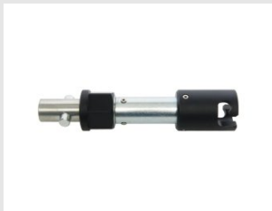
Artikel code 654910 VERLENGSTUK 200 MM - SDD