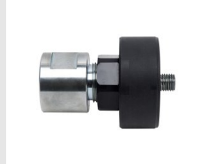
Artikel code 621001 ADAPTER MET STOFKAP M16 / M41