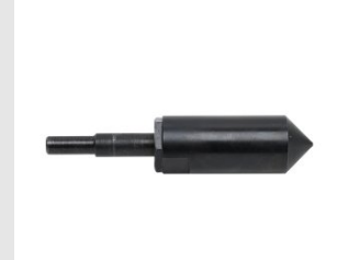
Artikel code 621005 CENTREERPUNT 85 MM - M41 / M16 DROOGBOORSYSTEEM