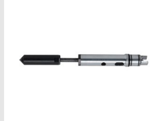
Artikel code 621003 CENTREERPUNT 200MM - SDD