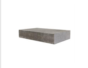
Artikel code 622200 SCHERPSTEEN VOOR DIAMANT