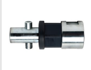
Artikel code 621000 ADAPTER MET STOFKAP SDD / M41