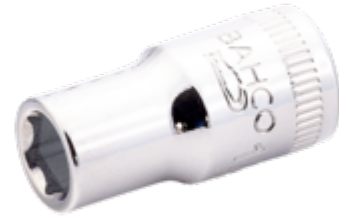
Schroevendraaierdopsleutel met 1/4" aandrijfvierkant met 1/2" zeskantprofiel 6700SZ-1/2