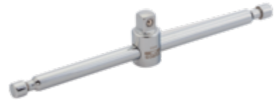
Dwarsgreep met 1/4" aandrijfvierkant, 140 mm 6954