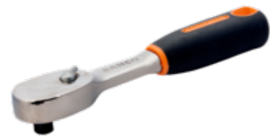
1/4" omkeerbare ratel met peervormige kop met 72 tanden en actiehoek van 5° 120 mm 6950