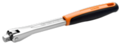
Handgreep met 1/4" aandrijfvierkant met scharnierende kop, 153 mm 6958