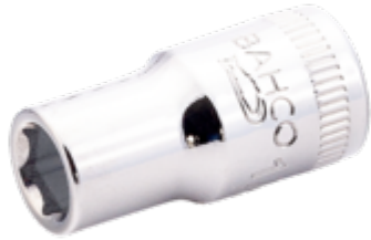
Schroevendraaierdopsleutel met 1/4" aandrijfvierkant met 9/32" zeskantprofiel 6700SZ-9/32