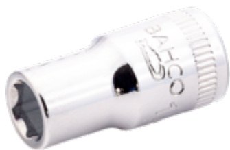
Schroevendraaierdopsleutel met 1/4" aandrijfvierkant met 5/32" zeskantprofiel 6700SZ-5/32