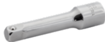
Verlengstuk met 1/4" aandrijfvierkant, 50 mm 6960