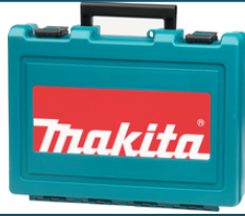
Koffer (1 stuks) - 158775-6 - 3240890276278