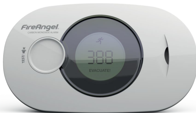
let op: logo en markeringen kunnen per EU land verschillen