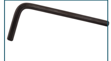
Inbussleutel 4,0 mm (1 stuks) - 783202-0 - 0088381102667