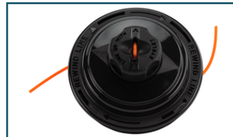
Snelvul draadkop T&G M10x1,25LH (1 stuks) - T-01753A - 0088381242493

Dit is slechts een kleine greep uit het ruime assortiment. Kijk voor alle accessoires/verbruiksartikelen in de Catalogus of op www.makita.nl .