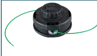
Draadkop 2x2,0mm T+G M10x1,25lh (1 stuks) - 191D89-4 - 0088381559270