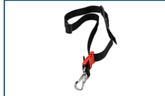
Draagriem (1 stuks) - 125516-5 - 0088381359764