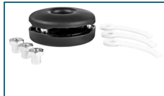
Maaikop kunststof messen 255mm (1 stuks) - 198383-1 - 0088381488129