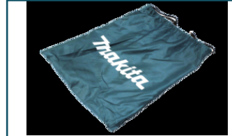
Gereedschapszak (1 stuks) - 831304-7 - 0088381361484