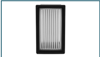
HEPA fijnstoffilter voor diverse stofboxen (1 stuks)