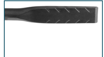
Koudbeitel premium 20x250mm SDS-PLUS (1 stuks)