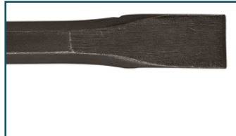
Koudbeitel 20x250 mm SDS-PLUS (1 stuks)