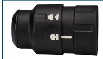
SDS-PLUS Boorkop (1 stuks)

- 191F47-2 - Goingsprijs € 27,50 - 0088381560801