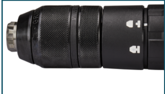
Boorkop snelspan 1,5-13mm (1 stuks)