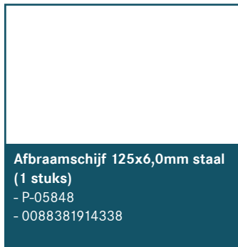
Afbraamschijf 125x6,0mm staal (1 stuks) - P-05848 - 0088381914338