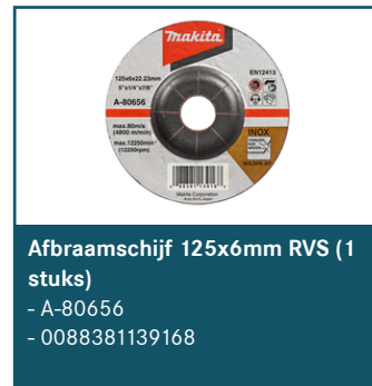
Afbraamschijf 125x6mm RVS (1 stuks) - A-80656 - 0088381139168