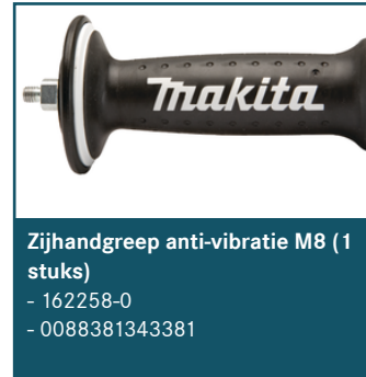
Zijhandgreep anti-vibratie M8 (1 stuks) - 162258-0 - 0088381343381