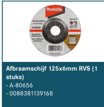
Afbraamschijf 125x6mm RVS (1 stuks) - A-80656 - 0088381139168