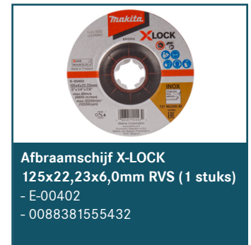
Afbraamschijf X-LOCK 125x22,23x6,0mm RVS (1 stuks) - E-00402 - 0088381555432

Dit is slechts een kleine greep uit het ruime assortiment. Kijk voor alle accessoires/verbruiksartikelen in de Catalogus of op www.makita.nl .