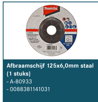
Afbraamschijf 125x6,0mm staal (1 stuks) - A-80933 - 0088381141031