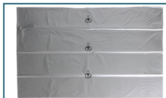
Foliezak "plastic" (1 stuks) - 195432-5 - 0088381369473