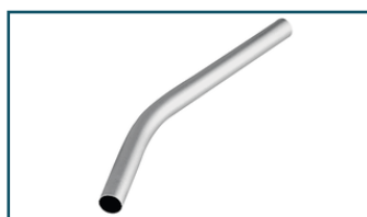
Zuigbuis bocht alu (1 stuks) - 192562-3 - 0088381141116