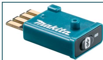
AWS zender WUT01 (1 stuks) - 198900-7 - 0088381497749