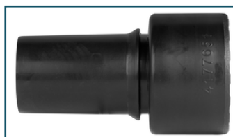
Slangadapter 25/22mm [Machine] (1 stuks) - 417765-1 - 3240890348234