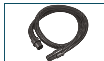
Zuigslang 38x2500mm (1 stuks) - 195434-1 - 0088381370271

Dit is slechts een kleine greep uit het ruime assortiment. Kijk voor alle accessoires/verbruiksartikelen in de Catalogus of op www.makita.nl .