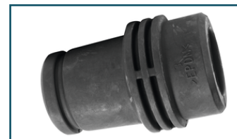
Koppeladapter 38-35mm/ribbed (1 stuks) - 424379-9 - 3240890329714