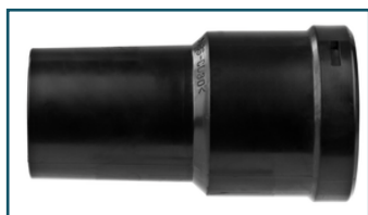
Slangadapter 45/38mm [Machine] (1 stuks) - 417307-1 - 8720023006064