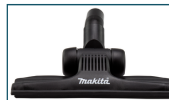
Vloerzuigmond (1 stuks) - 199455-5 - 0088381539692