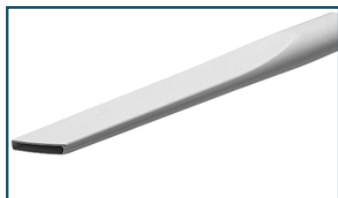
Kierzuigmond lang ivoor wit (1 stuks) - 410306-2 - 0088381123709