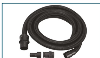
Zuigslang 28x3500mm (1 stuks) - 195433-3 - 0088381370264