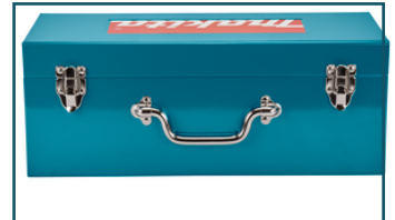
Koffer (1 stuks) - 181790-5 - 0088381118705