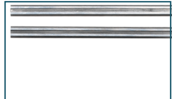
HM wisselbeitels 82mm (1 stuks) - D-07945 - 0088381181600