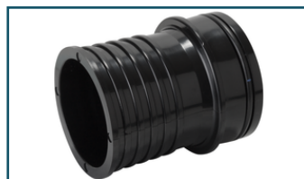
Koppeladapter 45x55mm (1 stuks) - JPA122275 - 0088381156202