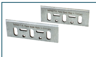
HM schaaftbeitels 82mm (1 stuks) - D-07967 - 0088381181624