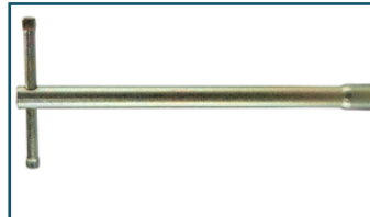
Dopsleutel 9mm (1 stuks) - 782209-3 - 0088381102568