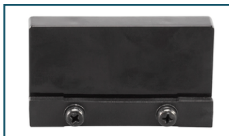
Schaafbeitel afstelmal (1 stuks) - 123062-2 - 0088381111270