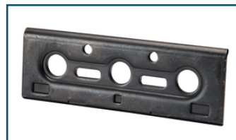
Wisselbeitelhouder 82mm (1 stuks) - A-86175 - 0088381150071