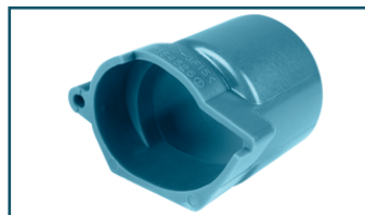
Stofafzuigadapter schaaf (1 stuks) - 415452-6 - 0088381142717