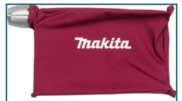
Spaanzak "linnen" (1 stuks) - STEX122312 - 0088381114974

Dit is slechts een kleine greep uit het ruime assortiment. Kijk voor alle accessoires/verbruiksartikelen in de Catalogus of op www.makita.nl .