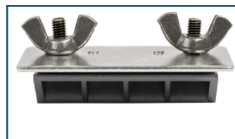
Schaafbeitel slijphouder 82mm (1 stuks) - 123004-6 - 0088381115391