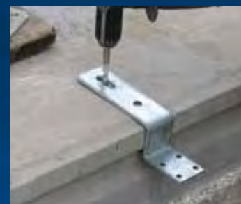
plaatsen Vloer-kozijnstrip en boren gaten