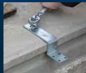
aandraaien bevestigingsmiddelen (volgens richtlijnen leverancier)