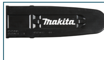
Transportbescherming 25cm (1 stuks) - 458501-6 - 3240890495730