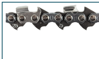
Carving ketting 25AP "rnd" 1/4x1,3 S60 (1 stuks) - 194098-8 - 0088381197656