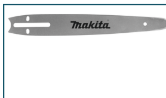
Zwaard "carving" 25x1,3x1/4" (1 stuks) - 168407-7 - 0088381197786

Dit is slechts een kleine greep uit het ruime assortiment. Kijk voor alle accessoires/verbruiksartikelen in de Catalogus of op www.makita.nl .