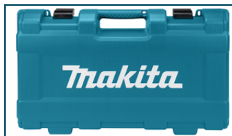
Koffer kst (1 stuks) - 821795-0 - 8720023037150