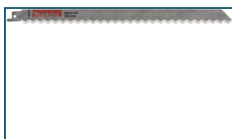
Reciprosnijblad 280 isolatie (1 stuks) - P-80444 - 0088381430999