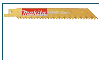
Reciprozaagb 130 HM S641HM (1 stuks) - P-05044 - 0088381914192