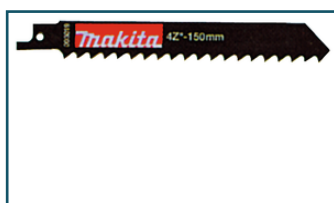
Reciprozaagb 130 hout (1 stuks) - P-04999 - 0088381914147