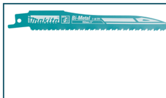
Reciprozaagb 132 met. S123X (1 stuks) - B-05038 - 0088381200592