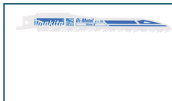
Reciprozaagb 132 H&M SA345XF (1 stuks) - B-05044 - 0088381200608