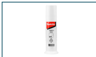
Boor- en beetelvet 100ml dispenser (1 stuks) - 198993-4 - 0088381518994