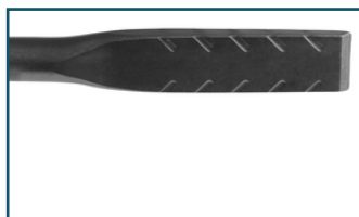
Koudbeitel premium 20x250mm SDS-PLUS (1 stuks) - B-64244 - 0088381534451