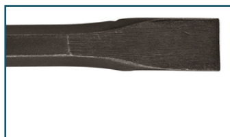
Koudbeitel 20x250 mm SDS-PLUS (1 stuks) - D-08729 - 0088381179539