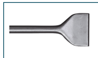
Platbeitel 38x200 mm SDS-PLUS (1 stuks) - P-24935 - 0088381951845

Dit is slechts een kleine greep uit het ruime assortiment. Kijk voor alle accessoires/verbruiksartikelen in de Catalogus of op www.makita.nl .