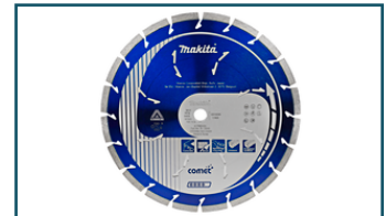
Diamantschijf 350x25,4x3,2mm blauw (1 stuks) - B-13552 - 0088381359269

Dit is slechts een kleine greep uit het ruime assortiment. Kijk voor alle accessoires/verbruiksartikelen in de Catalogus of op www.makita.nl .