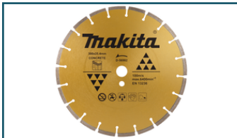
Diamantschijf 350x25,4x3,0mm (1 stuks) - D-56998 - 0088381458092