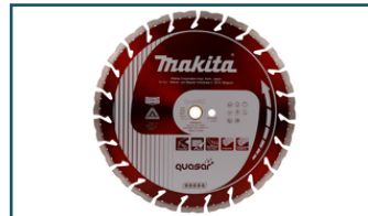
Diamantschijf 350x25,4x3,0mm rood (1 stuks) - B-13465 - 0088381359177