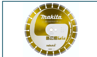
Diamantschijf 350x25,4x3,0mm oranje (1 stuks) - B-54053 - 0088381476553