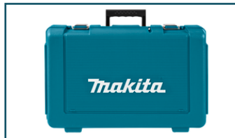
Koffer (1 stuks)