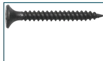
Schroeflint gipsplaat 3,9x25mm (1 stuks)