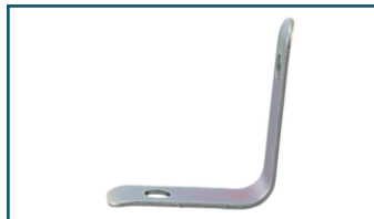
Draaghaak (1 stuks)