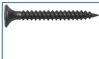
Schroeflint gipsplaat 3,5x35mm met boorpunt (3 stuks)