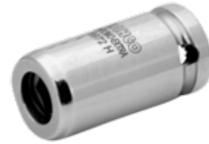
Verloopstuk met 1/4" aandrijfvierkant voor 1/4" zeskantbit voor schroevendraaier 6972H