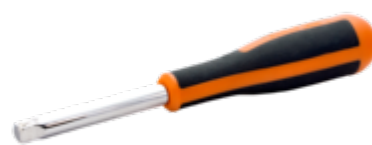
Handgreep met 1/4" aandrijfvierkant, 150 mm 6956