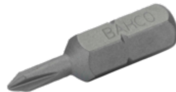
Standaard bit 1/4" voor Phillips PH3 schroeven 25 mm - 10-delig in kunststof doos 59S/PH3