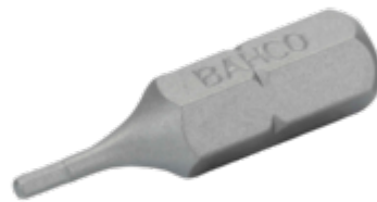
Standaard bit 1/4" voor 4 mm zeskantschroeven 25 mm - 5-delig in kunststof doos 59S/H4