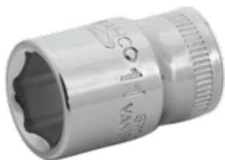
Schroevendraaierdopsleutel met 1/4" aandrijfvierkant met 13 mm zeskantprofiel en hooggepolijste afwerking 6700SM-13