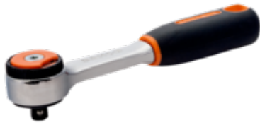
1/4" omkeerbare ratel met ronde kop met 72 tanden en actiehoek van 5° 120 mm 6950RN