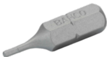
Standaard bit 1/4" voor 5 mm zeskantschroeven 25 mm - 5-delig in kunststof doos 59S/H5