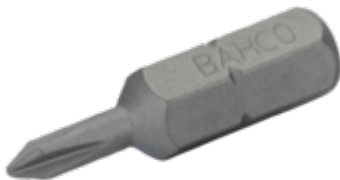
Standaard bit 1/4" voor Phillips PH1 schroeven 25 mm - 10-delig in kunststof doos 59S/PH1