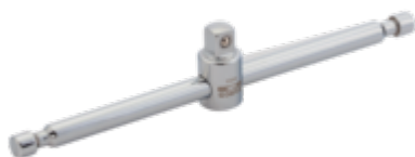
Dwarsgreep met 1/4" aandrijfvierkant, 140 mm 6954