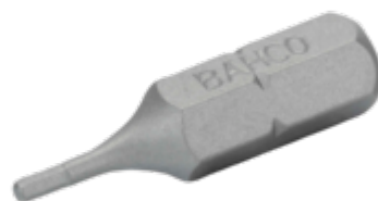
Standaard bit 1/4" voor 6 mm zeskantschroeven 25 mm - 5-delig in kunststof doos 59S/H6