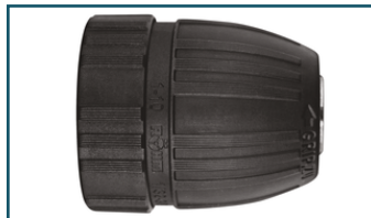
Boorkop snelspan 1-10mm (1 stuks) - 766012-0 - 3240890358196