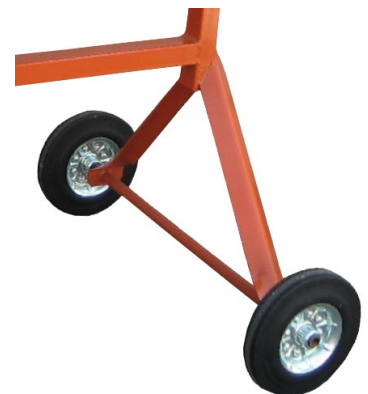
Stabiel gelast frame voorzien van wielen met volrubber band en stalen velg.