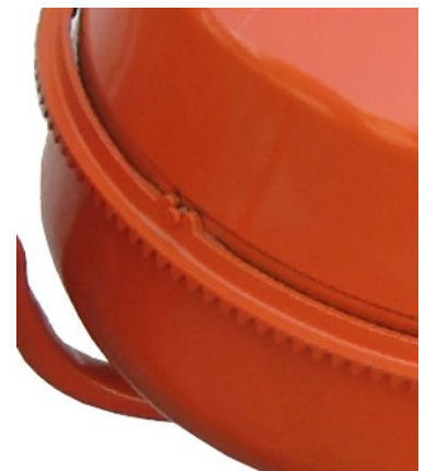
Breukbestendige stalen tandkrans.