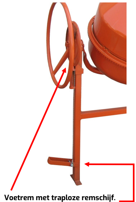
Voetrem met traploze remschijf.