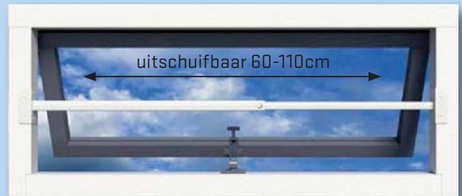
inbouwdiepte steunen 45mm