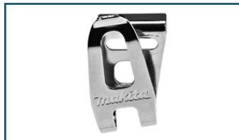
Draaghaak kort (1 stuks)