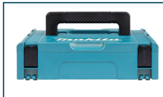
Mbox nr. 1 (1 stuks)