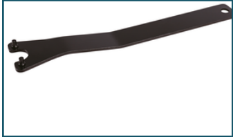
Nokkensleutel (1 stuks) - 782034-2 - 8720023146524