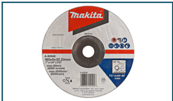
Afbraamschijf 180x6,0mm staal (1 stuks) - A-80949 - 0088381141048