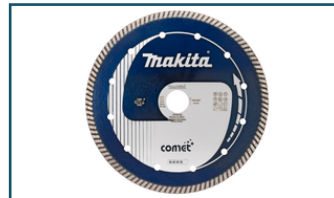
Diamantschijf 180x22,23x2,4mm (1 stuks) - B-13013 - 0088381358200