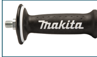
Zijhandgreep anti-vibratie M 14 (1 stuks) - 162264-5 - 0088381345828