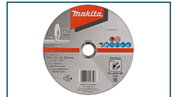
Doorslijpschijf 180x22,23x1,6mm aluminium (1 stuks) - B-45353

Dit is slechts een kleine greep uit het ruime assortiment. Kijk voor alle accessoires/verbruiksartikelen in de Catalogus of op www.makita.nl .