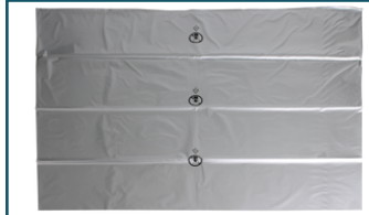
Foliezak "plastic" (1 stuks) - 195432-5 - 0088381369473