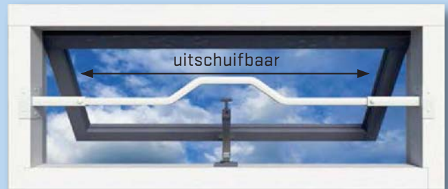
inbouwdiepte steunen 45mm