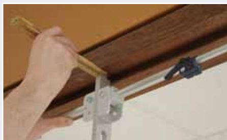
Afb. 7 Hangnaad midden verwerken