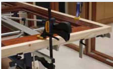
Afb. 21 Bovenzijde vastklemmen met 3e snelklemtang

15. Zet de schaafmachine op de gewenste schuinite, 86,90 of 94 graden (afb. 23).