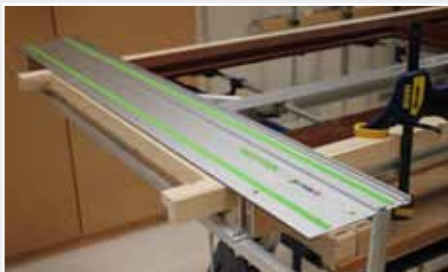
Afb. 18 Zaaggeleider

Let op! Het zaagblad moet net onder de deur komen, anders zaagt u de geleider af.