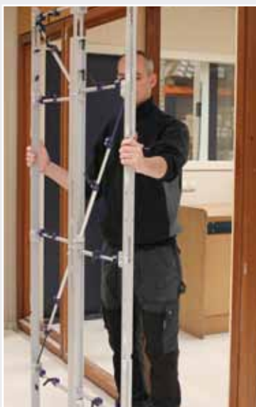
Afb. 10 Herpositionering Inmeetmal