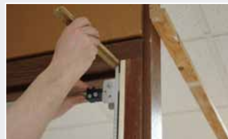
Afb. 8 Hangnaad rechts verwerken