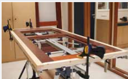
Afb. 22 Posities snelklemtangen