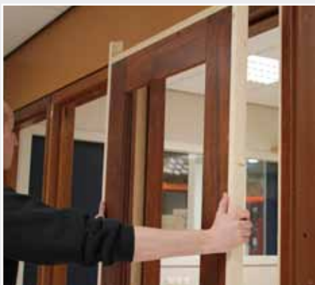
Afb. 12 Deur voor u nemen.