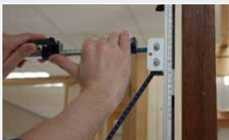
Afb. 3 Zijkant uitdrukken tegen de sponning