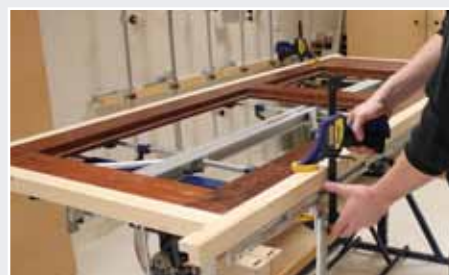
Afb. 17 Vastklemmen deur