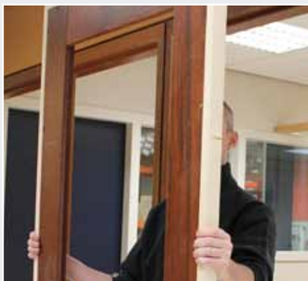
Afb. 13 Verplaatsen naar andere zijde van de deur