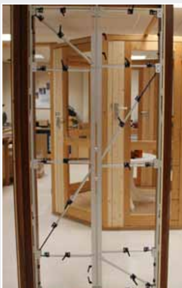
Afb. 9 Sponningmaat is gekopieerd.