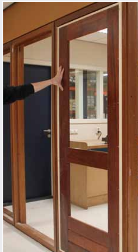
Afb. 26 Perfect passend resultaat

Overige: diverse hulpmiddelen zoals o.a. 3 stuks snelklemtangen en extra onderdelen.