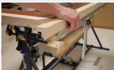
Afb. 16 Verdelen van de deur op de Inmeetmal