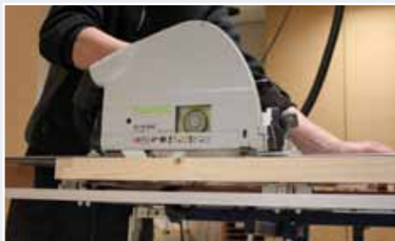
Afb. 19 Afzagen boven- en onderzijde