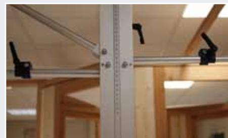
Afb. 5 Afstand tussen buisjes ongeveer gelijk