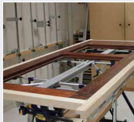
Afb. 14 Positionering deur op Inmeetmal