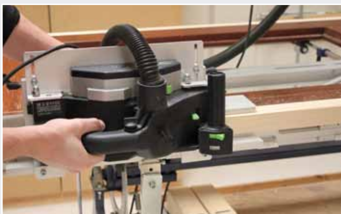
Afb. 24 Afschaven zijkant

Let op! Zorg ervoor dat de tweede geleider zo is ingesteld, dan aan beide zijden 2,5 mm van de deur over de Inmeetmal heen blijft steken.