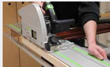
Afb. 20 Afzagen boven- en onderzijde

13. Klem de 3e snelklemtang op de deur aan de boven- of onderzijde vast (afb. 21).