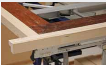
Afb. 15 Verdelen van de deur op de Inmeetmal