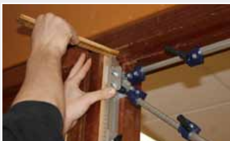
Afb. 6 Hangnaad links verwerken