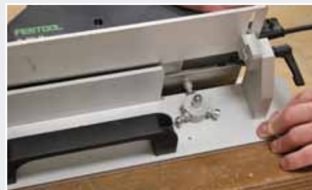
Afb. 23 Instellen Schaafmachine op gewenste schuinite

16. Schaaf de zijkant af met de speciaal omgebouwde Festool HL850 FB schaafmachine. Deze schaafmachine wordt met de Inmeetmal meegeleverd (afb. 24 & 25).