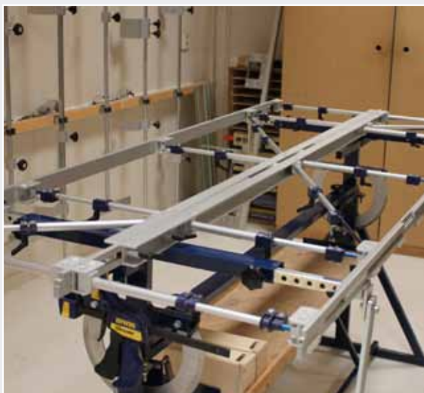
Afb. 11 Inmeetmal gepositioneerd op Draaitafel.