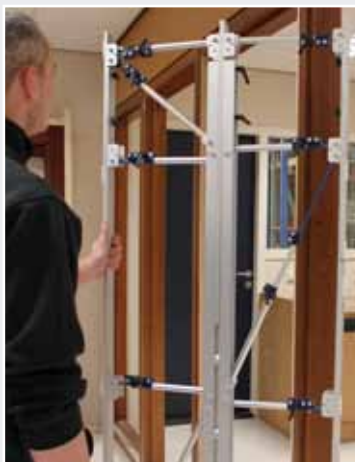
Afb. 1 Inmeetmal (klemmen aan de voorzijde)