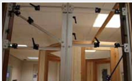
Afb. 4 Afstand buisjes bekijken