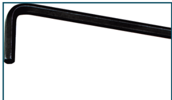
Inbussleutel 4,0 mm (1 stuks) - 783202-0 - 0088381102667