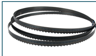
Zaagband 835x13mm 18T (1 stuks) - B-40559 - 0088381438384