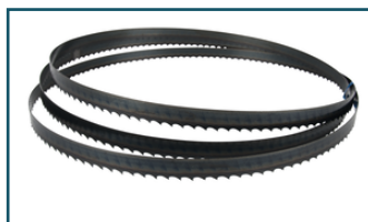
Zaagband 835x13mm 14T (1 stuks) - 0088381438377