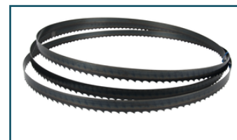
Zaagband 835x13mm 18T (1 stuks) - 3240890442581

Dit is slechts een kleine greep uit het ruime assortiment. Kijk voor alle accessoires/verbruiksartikelen in de Catalogus of op www.makita.nl .