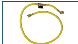
Vakuumslang (1 stuks) - AS0AI154MK - 0088381454230