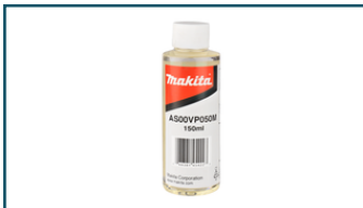
Vacuümpompolie voor DVP180 (1 stuks) - AS00VP050M - 0088381454223