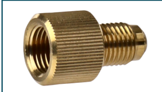
Adapter (1 stuks) - AS0Y06110K - 3240890455819