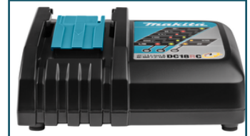
Oplader LXT DC18RC (1 stuks) - 195584-2 - 0088381373562