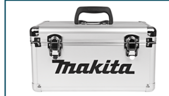
Koffer aluminium (1 stuks) - AS0VP007MK - 0088381455442