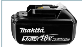
Accu BL1850B LXT 18 V 5,0Ah (1 stuks) - 197280-8 - 0088381459129