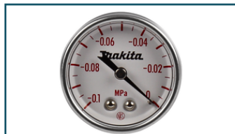
Vakuummeter (1 stuks) - AS00XP808M - 3240890455826