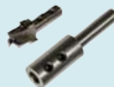
Art. 406503 en 601505

Met deze topkwaliteit freesbeitels is het mogelijk om twee freesgroeven met één freesbeitel te maken. De beitels zijn gemaakt van gehard stalen materiaal en zijn vervolgens met diamant geslepen. De frees is 3-snijdig. Houtspaanders worden hierdoor gemakkelijk afgevoerd. Dit bevordert de kwaliteit van het freeswerk en de levensduur. U kunt ongeveer 150 tot 300 voorplaten uitfreesen. Tevens is de frees meerdere malen te slijpen. U bespaart hiermee kosten voor een nieuwe aan te schaffen frees. U dient een verlengstuk voor de frees (art. 601507) bij te bestellen. Wij adviseren u te frezen met een laag toerentalstand (1 t/m 3 op uw bovenfrees: 10.000 toeren tot maximaal 15.600 toeren).