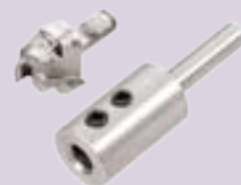
Art. 406504 en 601507