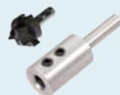
Art. 406512 en 601507