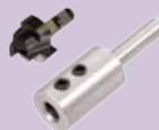
Art. 406510 en 601507