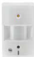
Videocamera met bewegingssensor