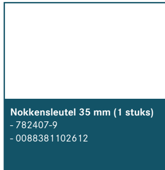
Nokkensleutel 35 mm (1 stuks) - 782407-9 - 0088381102612