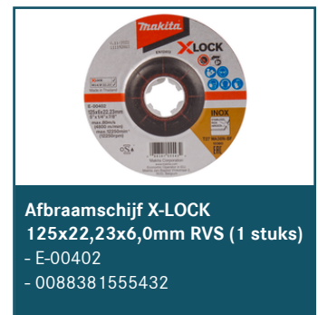
Afbraamschijf X-LOCK 125x22,23x6,0mm RVS (1 stuks) - E-00402 - 0088381555432

Dit is slechts een kleine greep uit het ruime assortiment. Kijk voor alle accessoires/verbruiksartikelen in de Catalogus of op www.makita.nl .