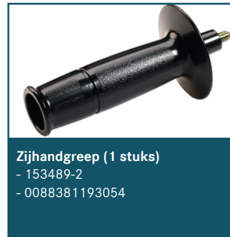
Zijhandgreep (1 stuks) - 153489-2 - 0088381193054