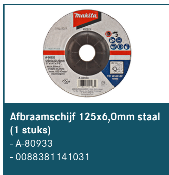
Afbraamschijf 125x6,0mm staal (1 stuks) - A-80933 - 0088381141031