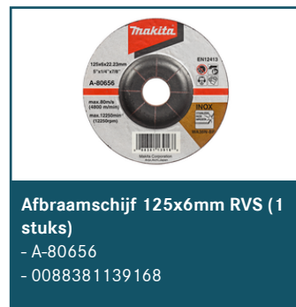
Afbraamschijf 125x6mm RVS (1 stuks) - A-80656 - 0088381139168