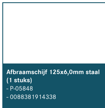
Afbraamschijf 125x6,0mm staal (1 stuks) - P-05848 - 0088381914338