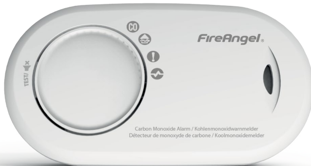
let op: logo en markeringen kunnen per EU land verschillen